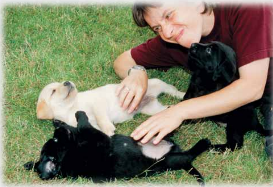
Die Aufrichtigkeit innerer Zuwendung des menschlichen Fürsorgegaranten und seine Feinfühligkeit im Erkennen und Erfüllen der natürlichen Bedürfnisse des Welpen ist die Grundlage für eine gelingende Verhaltens- und Wesensentwicklung.

Anhand des aufgezeigten Beispiels lässt sich schon bei erster grober Betrachtung feststellen, dass es dem Welpen möglich war, durch eigenes Tun etwas zu bewirken und dabei an-